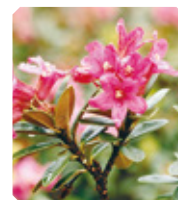
COSMOS オーガニック認証取得

スイスにあるアルプス山脈の高山に自生するツツジ科の可憐な花「アルペンローゼ」より得られる成分です。老化細胞による炎症・コラーゲン分解を抑制し、肌に柔らかさとハリを与えます。また、肌の赤みを抑制したり、酸化ストレスから肌を保護し、キメの整った肌へ導きます。